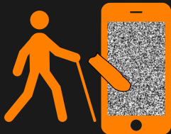
Abbildung: glatter Touchscreen ohne Orientierungspunkte